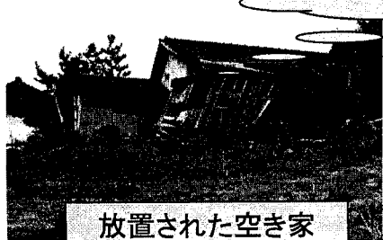
放置された空き家

Uターン者の受皿として、有効活用 ・受入住宅への改修 ・空き家バンク(登録紹介事業)等