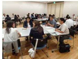
異業種交流会の様子

女性活躍に積極的に取り組もうとする企業・事業所を「なら女性活躍推進倶楽部」として登録し、関係団体や行政との連携により、男性も女性も働きがいを感じ、いきいきと働き続けることができる職場づくりを推進