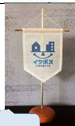
同盟ロゴマークと加盟証明品の卓上旗