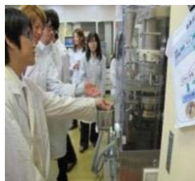
富山県薬事研究所