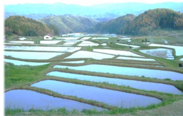
自らが生まれ育った 「郷土への誇り・愛着」の醸成