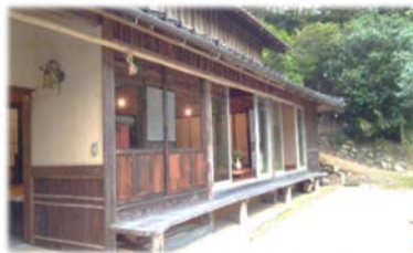
地方の魅力の再発見、発信