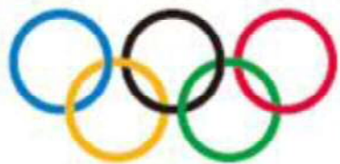
オリンピックシンボル