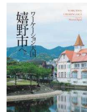
ワークーションリーフレット