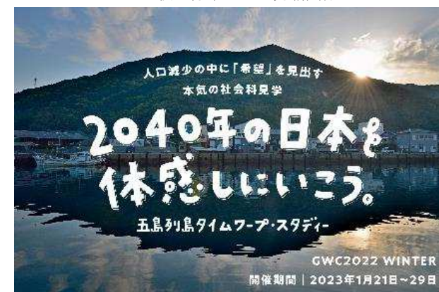
GWC2022 冬 募集サイト掲載画像