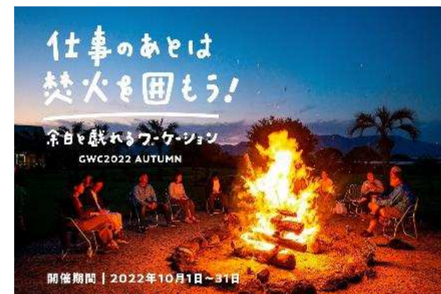
GWC2022 秋 募集サイト掲載画像