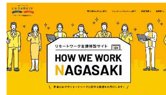
リモートワーク支援特設サイト 「HOW WE WORK NAGASAKI」

都市部企業との連携協定締結をはじめ、都市部企業による継続的なワーケーション実施。