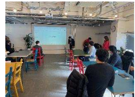
令和4年度ワーケーションマッチング促進事業 ワーケーション施設（=ODEN）見学の様子

ワーケーションの実施が可能な業種、働き方の企業と受入を希望する県内市域や地元事業者をマッチングさせることで、サテライトオフィスの設置や新しいビジネス機会の創出など再訪を促す取組に繋げる取組を実施