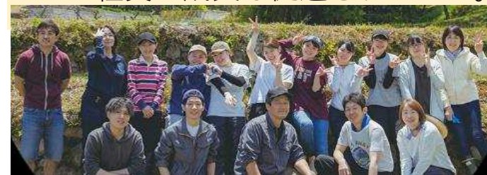
チャレンジ休日の活用で、いきいきと働く社員