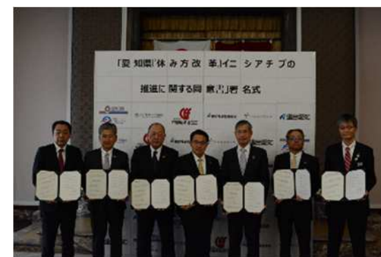
「愛知県『休み方改革』イニシアチブの推進に関する同意書」署名式の様子