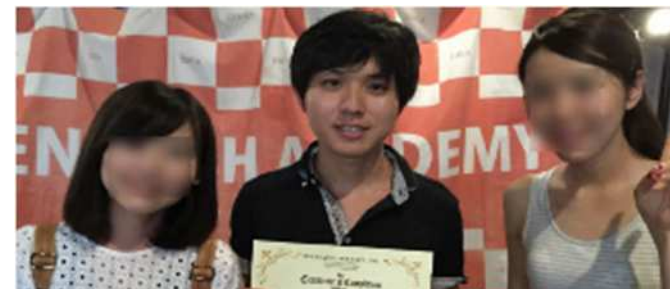
語学留学の卒業記念写真 (写真中央が当社従業員)

チャレンジ休暇取得実績 29件。 フィリピンへの語学留学や各種資格、検定の取得実績もあり、特に海外人材との交流場面や、会社のホームページ作成・広報の場面で力を発揮してもらっている。