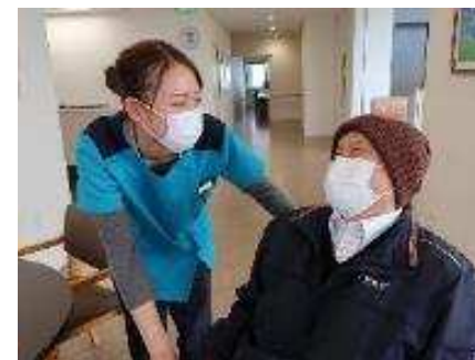
病院での患者さまと医療従事者のコミュニケーション風景