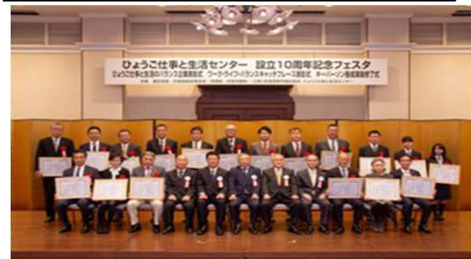
ひょうご仕事と生活のバランス表彰企業（2021年）