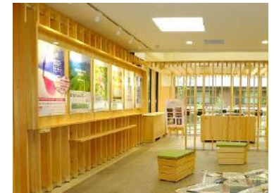
内装木質化（農林総合研究センター）