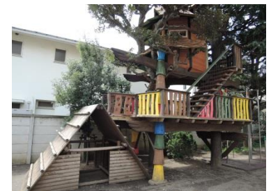
大型遊具（育英幼稚園）