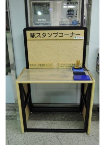
都営地下鉄スタンプ台