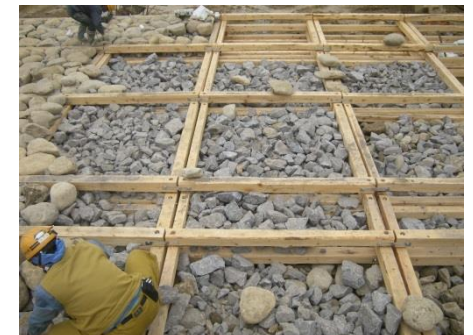
河川工事（護床工）の事例