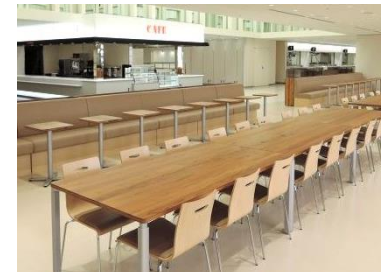
多摩産材テーブル（都庁食堂）