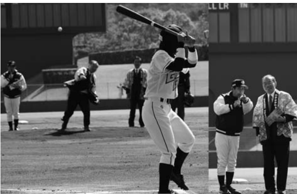
地元球団vs欽ちゃん球団の試合前に行われた始球式

たのですが、文字どおり香川県の宝となり、渇水のない年が続いてほしいと願ってやみません。