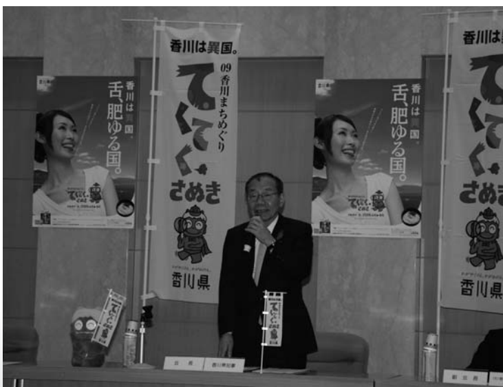
この春から始まる「09香川まちめぐり てくてくさぬき」の実行委員会

昼の十三時三十分からは、いよいよ始まる「09まちめぐり てくてくさぬき」の実行委員会を県庁二十一階でしました。今回の会議では、今まで決めてきたことの最終確認や、盛り上げる方法を皆で意見を出し合いました。「てくてくさぬき」とは、本県の知られざる魅力を体験してもらおうというまち歩き型観光です。さぬきうどんを食べたあとは、まちのガイドさんによる「まち歩き」をしたり、うどん打ち体験や、地域の祭りやイベントに参加したりして、皆様に楽しんでいただくうと思ひます。春は食、夏は遊び、秋は文化と季節ごとに「まち」や「ひと」を感じてもらおうテーマを設定しました。本県は、まち歩き型観光を平成十六年から、地