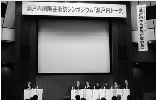
瀬戸内海国際芸術祭に向けて芸術家らと意見交換したシンポジウム

中農業大学の卒業式に出席し、うどんを食べたあと、JR高松駅の横にある「かがわ国際会議場」で平成二十二年七月十九日から始まる瀬戸内国際芸術祭ブレイベントのシンポジウム「瀬戸内トーク」に出席しました。シンポジウムでは芸術家と楽しく意見を交換しました。この芸術祭は瀬戸内海に浮かぶ直島や小豆島など七つの島と高松で現代アートの祭典を繰り広げるといふものです。今回のシンポジウムでは百日間にわたる芸術祭の概要を発表しました。各島にはいろいろな目玉イベントや作品が展開され楽しい内容となつて