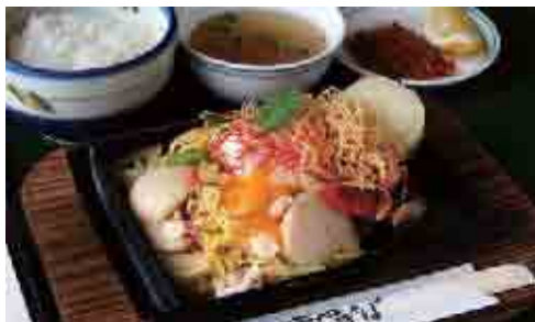
オホーツク北見塩焼きそば