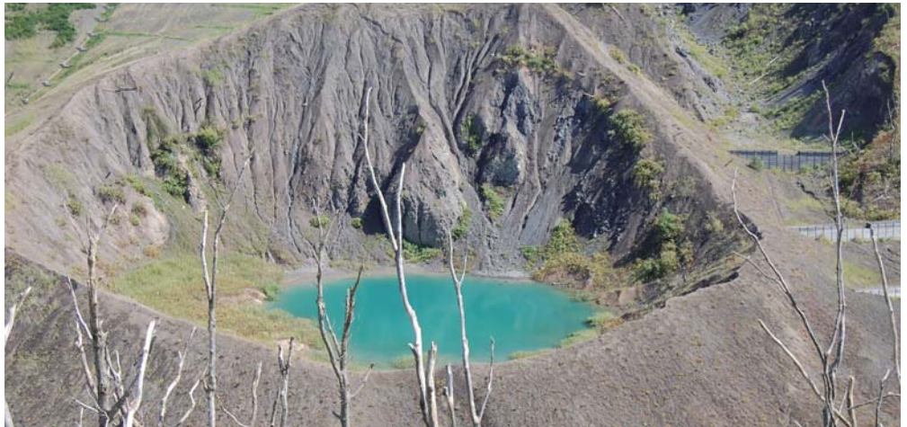
有珠山から名付けられた「有くん火口」と「珠ちゃん火口」(写真は「有くん火口」)