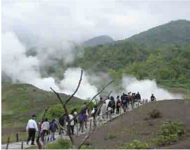
今も噴煙をあげる西山火口