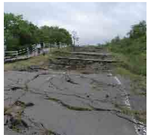
めくれ上がったアスファルト道路

そのほかにも、二〇〇〇年の噴火以降、今も噴煙を上げ続ける火口や、地殻変動でめくれ上がったアスファルト道路などを辿り、自然の力のすさまじさと痛ましさが体感できる「西山火口散策路」など、時間や体力にあわせてさまざまなルートを選ぶことができます。