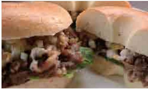
白老バーガー&ベーグル