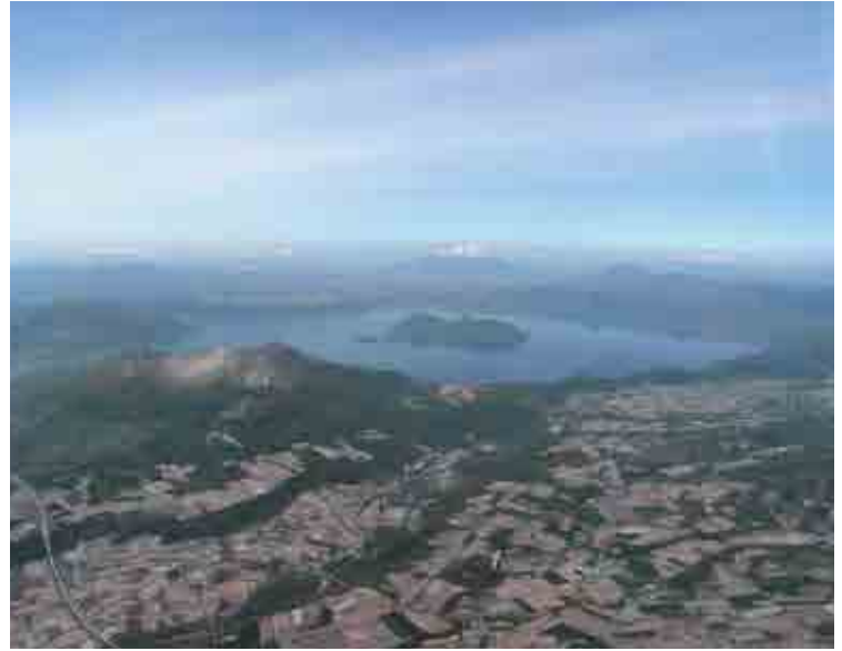
洞爺湖有珠山ジオパーク