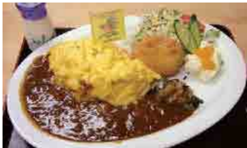
富良野オムカレー