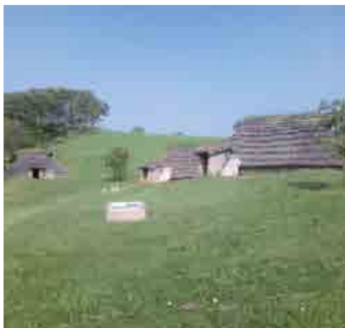
北黄金貝塚公園(伊達市)