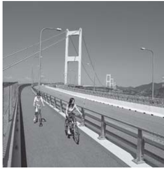
表紙の写真 開通10周年「瀬戸内しまなみ海道」 (愛媛県)