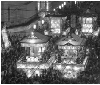
豪華絢爛な山車祭り(青森県)