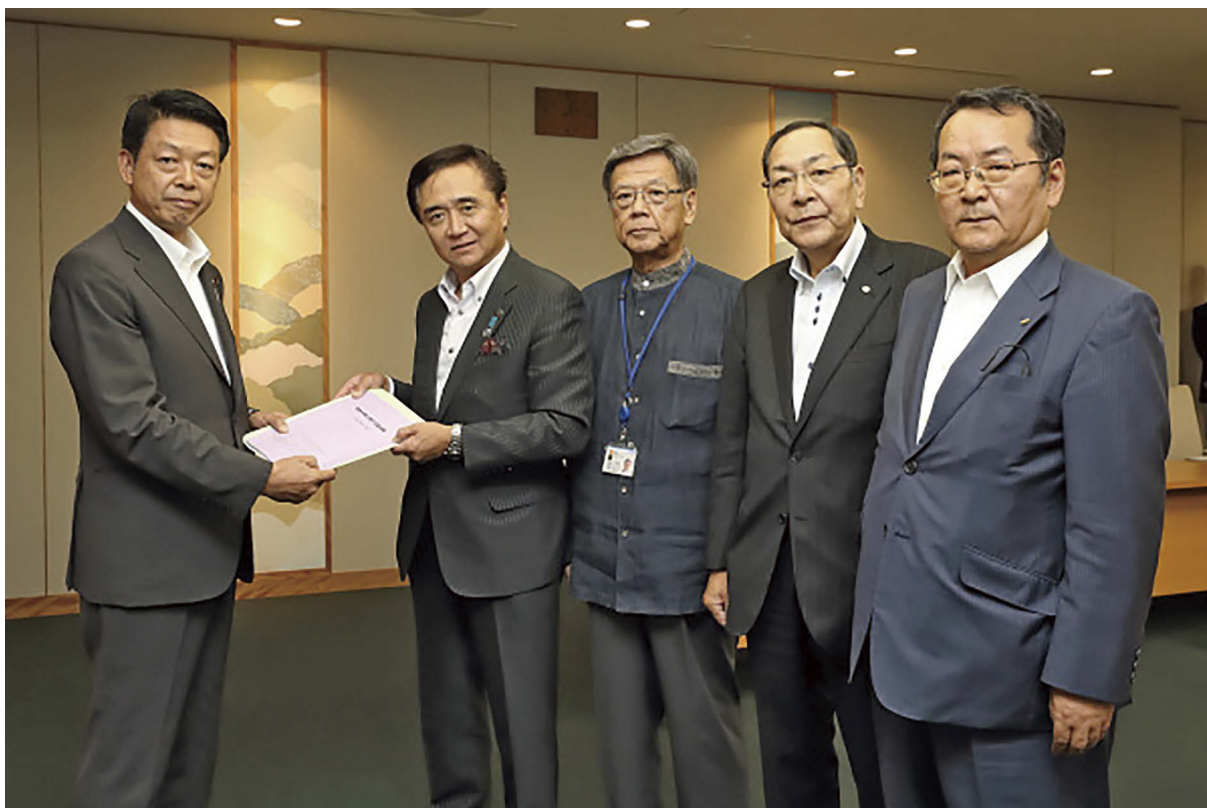
外務省での要請活動(平成28年7月) 武藤外務副大臣(当時)(左)へ要望書を手渡す黒岩神奈川県知事

そこで、日米地位協定に次の6本の柱に掲げる15項目を明記することにより、日米地位協定を改定することを政府に働きかけるとともに、米国側にも理解を求めています。