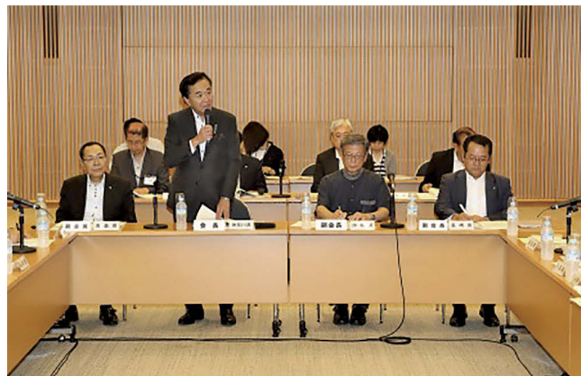
平成28年度定期総会(前列左から青森県副知事、神奈川県知事、沖縄県知事、長崎県副知事)